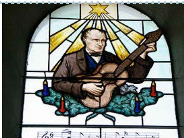
De componist van Stille Nacht, Franz Xaver Gruber, afgebeeld in een raam van de 'Stille Nacht-Kapelle' in Oberndorf, de plaats waar het lied op 24 december 1818 voor het eerst gezongen is.