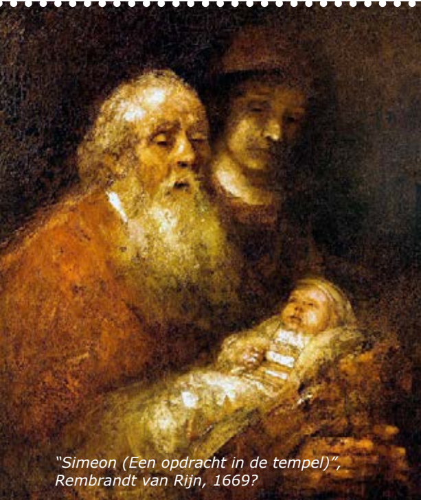
"Simeon (Een opdracht in de tempel)", Rembrandt van Rijn, 1669?