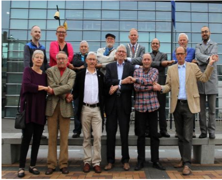
Kerken Heerhugowaard in verzet tegen armoede