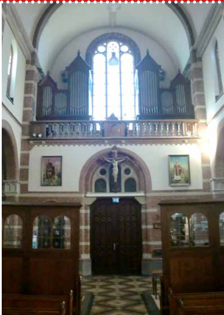
het gerestaureerde orgel van de Corneliuskerk in Limmen

In oktober organiseert de NSGV Haarlem-Amsterdam nog twee kinderkoorfestivals. Informatie hierover volgt later.