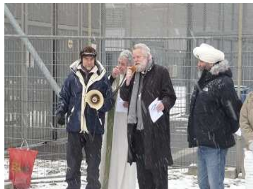
Bisschop bij wake Schiphol-Oost