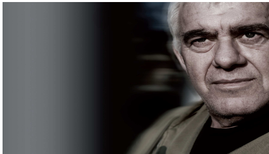
Van Dak Tot Dak: de leefwereld van bijzondere mensen.

De expositie is te vinden in Noord Hollands Archief, Jansstraat 40 te Haarlem.